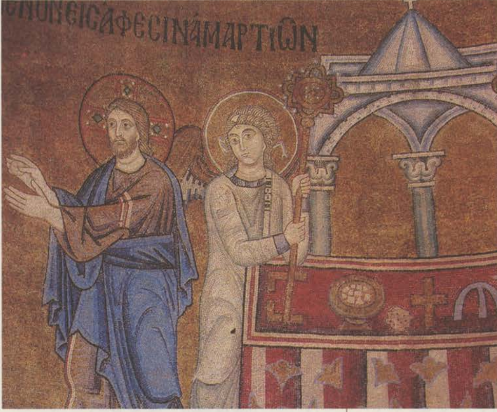
Res. 2 Litürjik son akşam yemeği (ökaristi) sahnesinden ayrıntı, Kiev Aya Sofya Kilisesi apsis resmi, 11. yüzyıl ortaları.

tasvirli kutsal ekmek mühürleri genellikle erken Bizans ve İkonoklazma dönemlerine tarihlendirilmekle birlikte günümüze kadar ekmek mühürleri üzerinde en çok haç kompozisyonlarının tercih edildiği görülmektedir. Haç tasvirleri genellikle yuvarlak, altıgen bir çerçeve ya da iki sütuna dayanan bir kemer içine alınmıştır. 19 Haç kolları arasında İsa'nın sıfatları, sonsuzluğunu vurgulayan yazı ve semboller ile haçın çevresinde İncil'den alıntılar, 20 bazı örneklerde ise mührün arka kısmında adak yazıtları bulunmaktadır. 21 IC XC NI KA (Tanrı oğlu kurtarıcı İsa'nın zaferi), 22 Tanrı'nın başlangıç ve son olduğuna işaret eden Grek alfabesinin ilk ve son harfi (A ve O/ω), sağlık (ΥΓΙΑ), hayat (ΖΟΕ), ışık (ΦΟΣ), neşe (ΧΑΡΑ), Tanrı'nın armağanı, Tanrı'nın meyveleri, Tek Tanrı'ya ve Oğul gibi simgesel anlamlar içeren sözcüklerle anlamını çözemediğimiz monogramlar çoğunlukla da ters bir şekilde yazılmıştır. Ters olması, basıldığı yüzeyde düz çıkarak okunabilmesi içindir. Haç kollarının etrafında bazen yazı yerine yuvarlak biçimli çukurlar ya da kuş, balık ve geyik gibi sembolik anlamlar içeren hayvan figürleri bulunur. 23