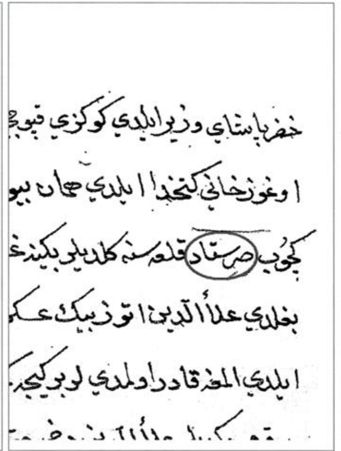
Resim 2 / Picture 2