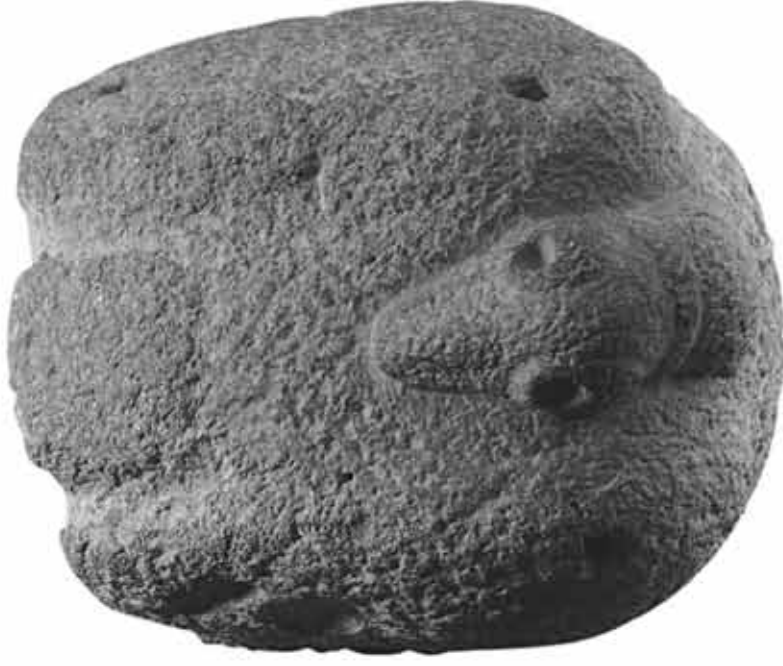
Resim 1: Üstten Görünüş (Ölçeksiz)