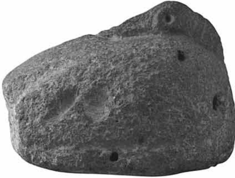
Resim 2: Sağ Yandan Görünüş (Ölçeksiz)