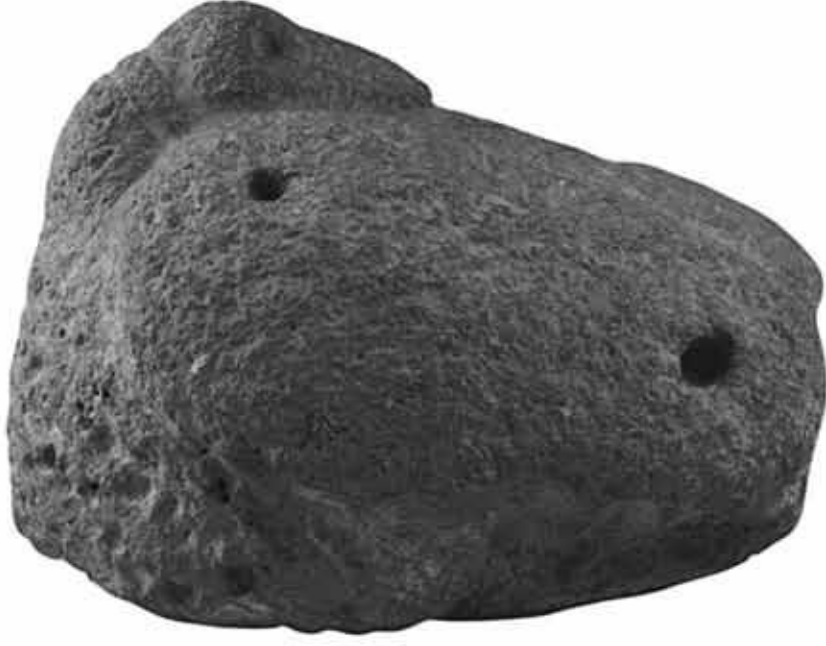
Resim 3: Sol Yandan Görünüş (Ölçeksiz)